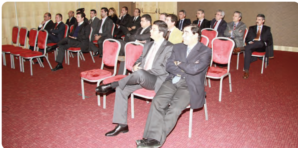
A Apresentação da Point S em Portugal contou com os representantes das principais marcas de pneus representadas no nosso país